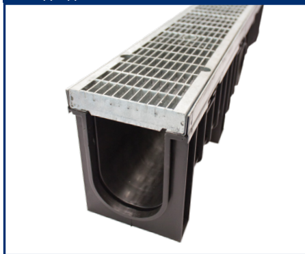
Одводен канал Evomax 100H

Носивост 25t Висина 209mm Каналот е изработен од HD-PE пластика, рамката и решетката се поцинковани.