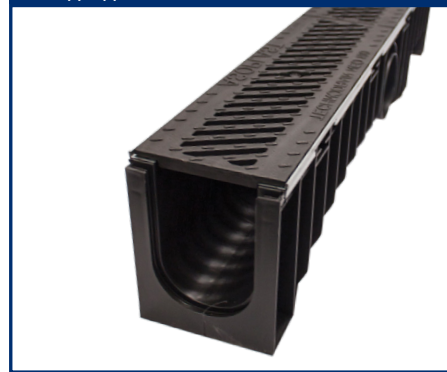
Одводен канал Neomax 100H

Носивост 25t Висина 209mm Каналот е изработен од HD-PE пластика, рамката и решетката се поцинковани.