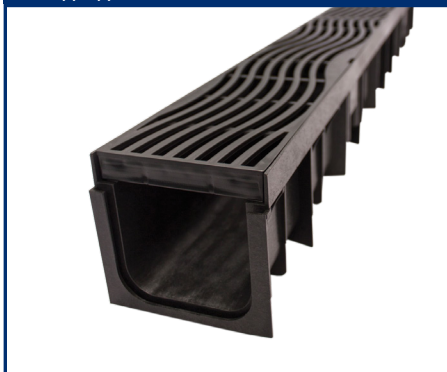
Одводен канал Wavedrain 110

Носивост 1,5t Висина 110mm Каналот и решетката се изработени од HD-PE пластика.